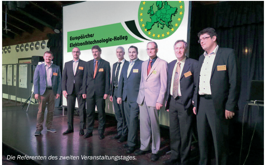
Die Referenten des zweiten Veranstaltungstages.

Das Europäische Elektroniktechnologie-Kolleg in Colonia de Saint Jordi auf Mallorca ist inzwischen der traditionsreichste Branchentreff zum Thema Baugruppen. Vom 16. bis zum 20. März 2016 fand unter dem Leitthema „Validierung von Prozessen“ die 19. Veranstaltung statt.