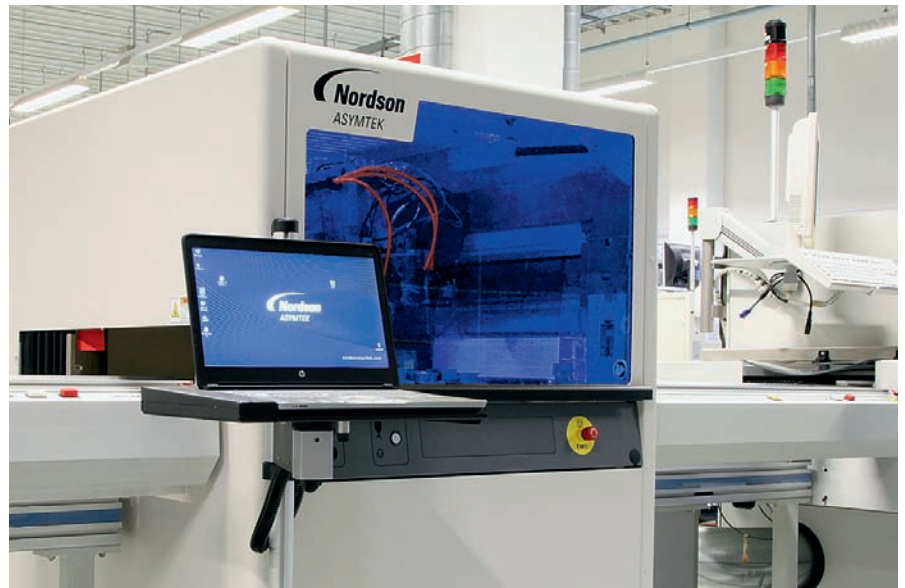
Das automatisierte Beschichtungssystem SL-940E Nordson von Asymtek bei Coronex im Einsatz.

Idealerweise erhalten wir Musterbaugruppen, die genaue Bezeichnung bzw. Spezifikation des zu verwendenden Lacks und entsprechende Vorgaben der zu lackierenden Bereiche. Mithilfe der Abmessungen der Baugruppe und der Bauteilhöhen erstellen wir dann das Programm.